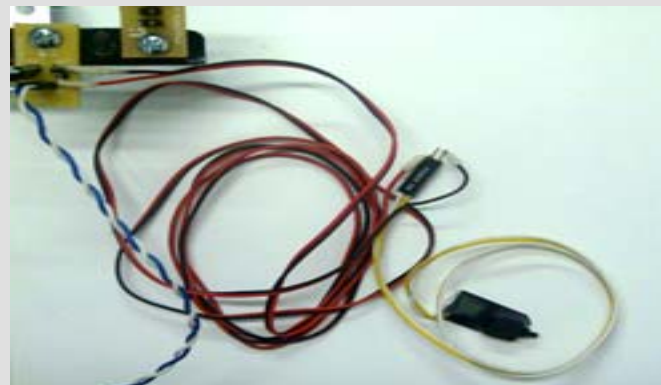
Figura 3: Com a outra ponta do cabo improvisado, conecte-a no interruptor de pressão, nesta operação utilize um garfo que compõe este kit.